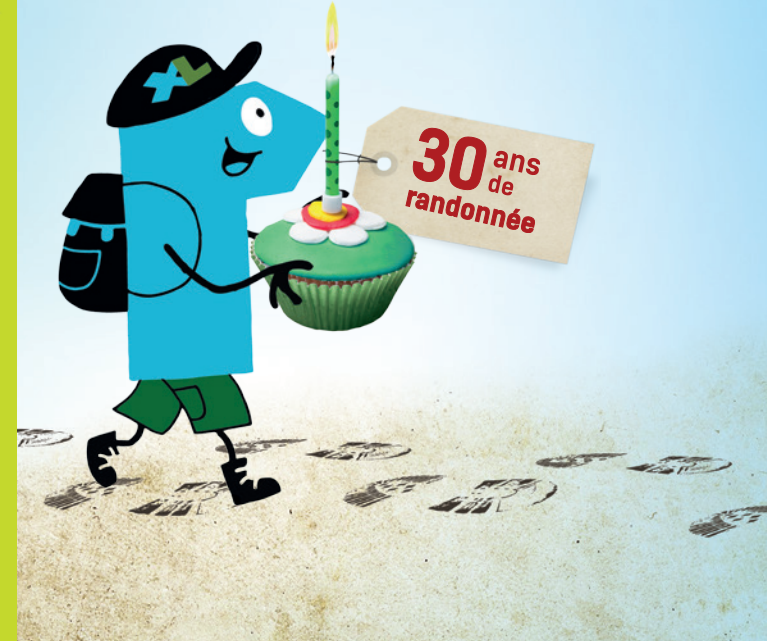
Illustration : Véronique Saüquère. Création originale : Esens, Conception-impression Dpr40, 08/2015

Journée de lancement Samedi 10 octobre 2015 DAX > Bois de Boulogne