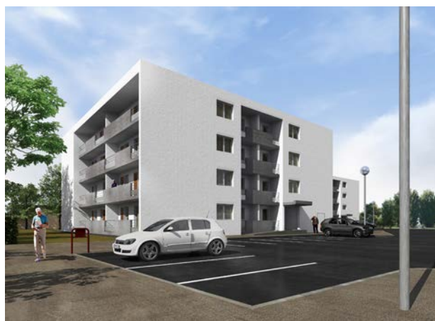
I Réhabilitation en cours de 30 logements collectifs, résidence « La Pologne » à Aire-sur-l'Adour, livraison prévue février 2016