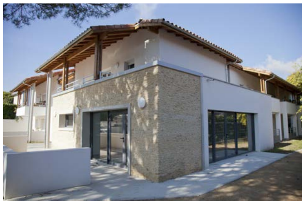
I La résidence pour seniors « Camille Brethes » à Saint-Pierre-du-Mont livrée en août 2015

« En 2016, 55,5 M€ de travaux 416 emplois indirects »