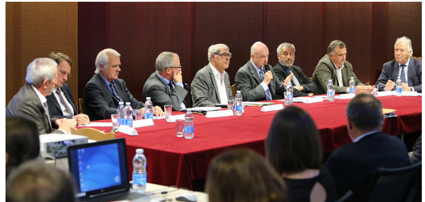
Le GIP Agrolandes Développement installé le 16 novembre 2015

L'objectif et l'ambition de cette démarche est de devenir « le centre de référence national et international » sur les thématiques d'excellence du technopôle et favoriser ainsi l'implantation d'entreprises et de projets sur le parc d'activités.