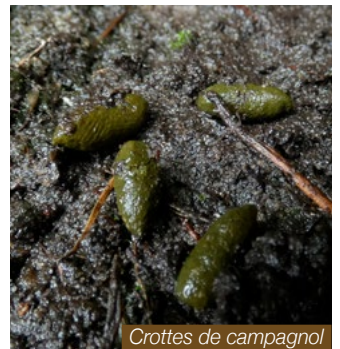
Crottes de campagnol