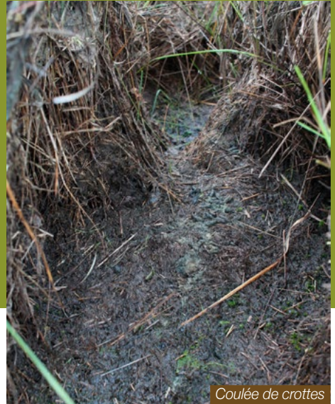
Coulée de crottes

En France, il existe une espèce plus petite, le Campagnol de Lavernède ( Microtus Lavernedii ), dont l'aire de répartition s'étend sur l'ensemble du département. Il occupe les mêmes milieux que le Campagnol amphibie. Les indices de présence sont identiques aux deux espèces, seule la taille des crottes et des galeries est inférieure.