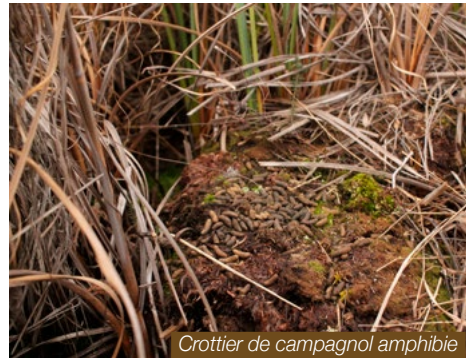
Crottier de campagnol amphibie