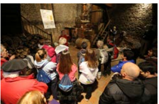
Randonnée dégustation Domaine d'Ognoas