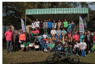
Vainqueurs Randolandes Dax