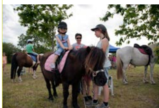
Animation Arjuzanx