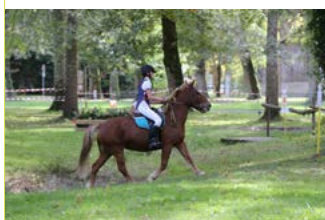
TREC Dax