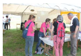
Les équipes en actions