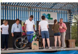
Remise des prix Arjuzanx