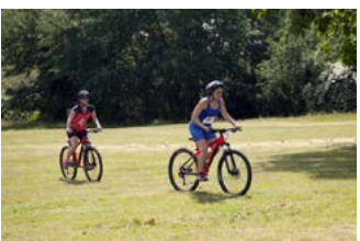
Randolandes Arjuzanx