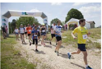
Randolandes Arjuzanx