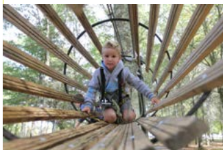
Animation Dax