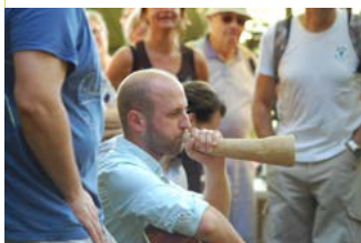
Randonnée musicale Brassempouy