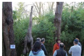
Randonnée contée à Sore