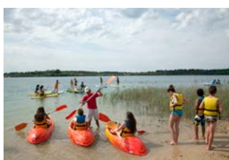
Animation Arjuzanx