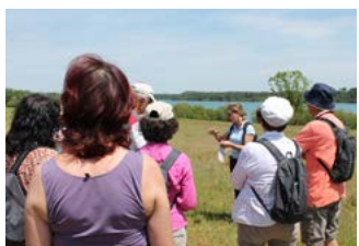
Randonnée Arjuzanx