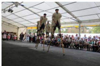
Animation Dax