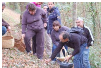
Randonnée mycologique Toulouzette