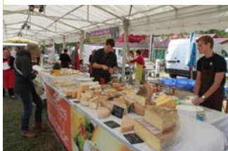
Marché producteurs locaux Dax