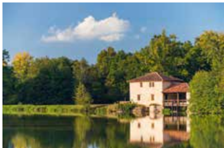
Moulin de la Gaube

Au sein des terres silico-argileuses, sur des plateaux bien ensoleillés, le vignoble du Domaine départemental d'Ognoas s'étend sur plus de 50 hectares et fournit un vin de distillation d'excellente qualité. Les millésimes d'armagnac d'Ognoas, composés des cépages Folle Blanche, Baco 22A et Ugni Blanc, fleurent bon la vanille et le pruneau.