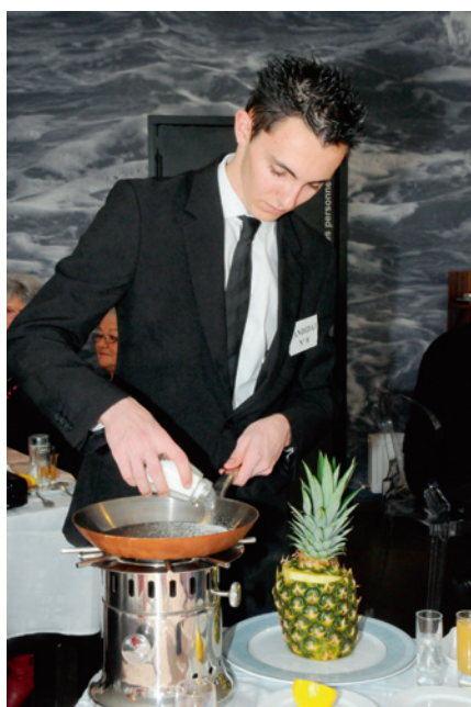
Œuvres réalisées lors du concours 2012