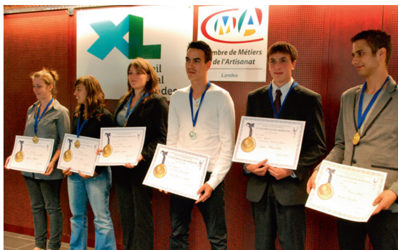
Concours « Un des Meilleurs Apprentis des Landes » 2011