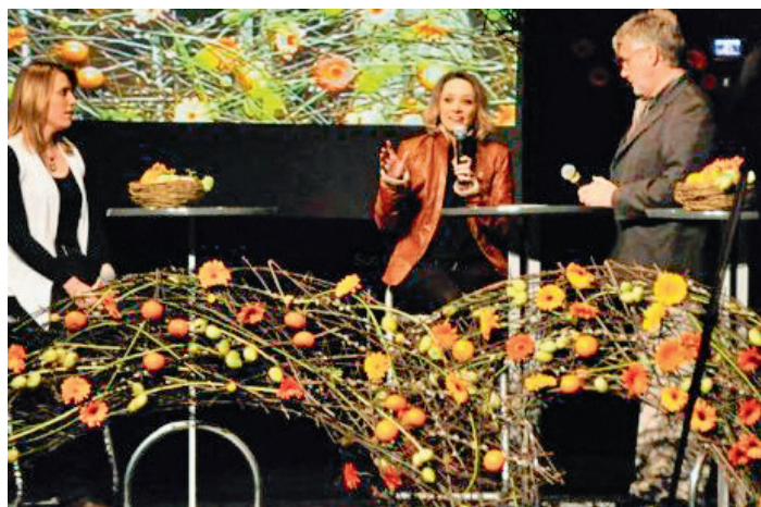
Présentation aux collégiens à Mont-de-Marsan le 3 avril 2012

Une restitution le 3 avril 2012 rassemblant près de 500 collégiens a permis aux nombreux invités et partenaires de découvrir les 4 films illustrant le travail réalisé. L'objectif de cette action partenariale est d'impliquer les collégiens dans leur orientation, qu'ils soient les messagers d'une orientation positive et de qualité vers les métiers et leurs formations professionnelles.