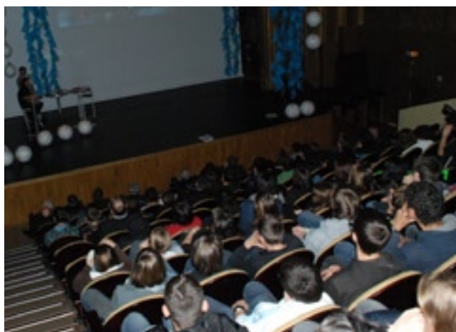
Présentation aux collégiens le 31 mars 2011 de « Bravo les Métiers »

Une restitution le 31 mars 2011 rassemblant près de 400 collégiens a permis aux nombreux invités et partenaires de découvrir le travail réalisé. L'objectif de cette action partenariale est d'impliquer les collégiens dans leur orientation, qu'ils soient les messagers d'une orientation positive et de qualité vers les métiers et leurs formations professionnelles.