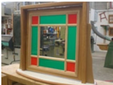
Œuvres réalisées lors du concours 2011