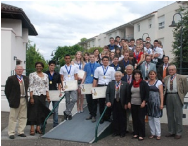
Médaillés du concours 2010