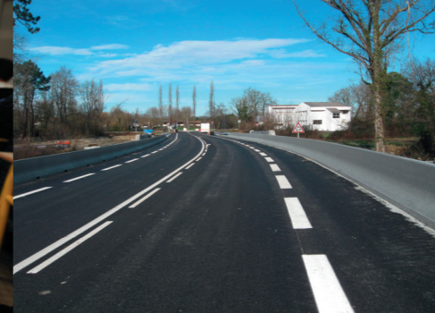
Mise en service de la section sud du contournement de Dax