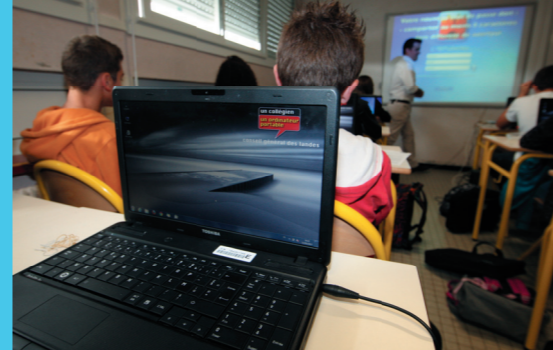
« un collégien, un ordinateur portable »

Dans ce contexte, les orientations budgétaires pour l'année 2014 sont proposées à l'Assemblée départementale avec un budget total prévisionnel de 467 M€, en progression de 4,4 %.