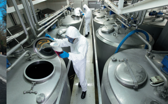
Le projet Agrolandes