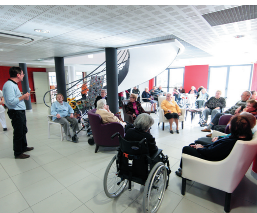
EHPAD de Saint-Paul-lès-Dax

Les investissements des collectivités et des acteurs économiques doivent être encouragés.