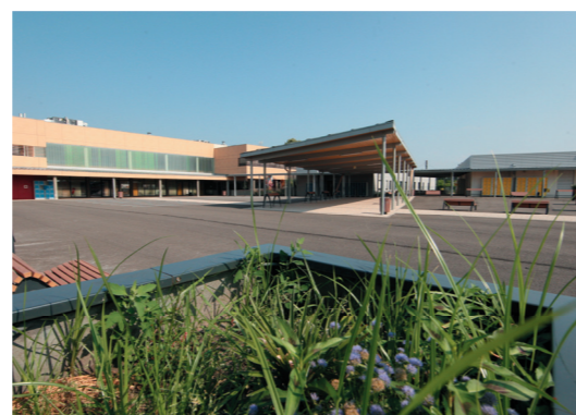
Le collège de Labouheyre

D'importants moyens seront également consacrés au démarrage de la construction du collège de Labrit (10 M€) et à la rénovation des collèges existants (10,2 M€).