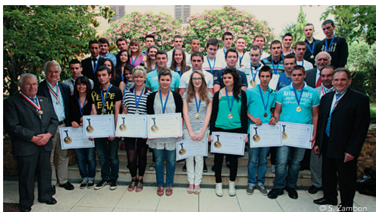
Les Meilleurs apprentis des Landes 2012

8 centres de formations d'apprentis, 15 lycées professionnels et lycées d'enseignement général et technologique landais étaient représentés.