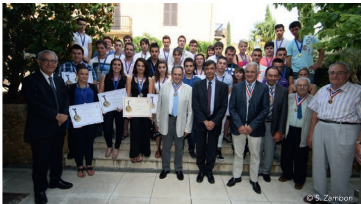
Les Meilleurs apprentis des Landes 2014

En cohérence avec les actions existantes en faveur de l'apprentissage et des métiers, le Département a instauré un nouveau dispositif de prêt sans intérêt permettant sous condition de ressources, de favoriser l'accès à l'apprentissage qui s'inscrit dans le cadre des nouvelles orientations de la politique départementale jeunesse s'articulant autour de la notion de « parcours de jeunesse ».