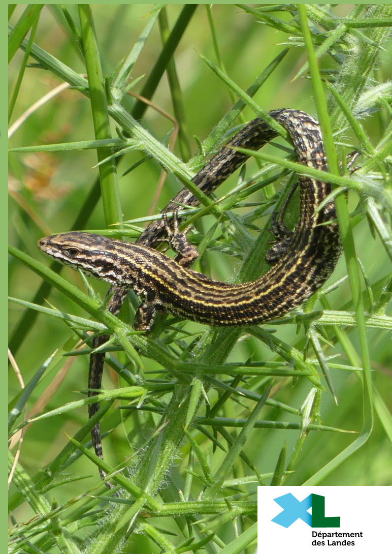
Concept - impr. : service graphique / Dp40 - 07/2023