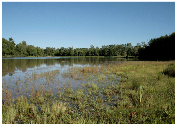
Etang de Lamarque (Hontanx)

Le règlement départemental prévoit notamment la rédaction de plans de gestion systématiques sur les ENS. A ce jour, 69 % des sites sont pourvus de documents de gestion.