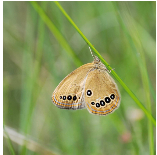
Fadet de Laïches

le Département, par le biais des gardes-nature va participer au programme de connaissances des papillons des zones humides (Fadet des laïches, Cuivré des marais, Damier de la succise, Azuré des Mouillères et Azuré de la Sanguisorbe). Il s'agit d'un programme sur 3 années pour lequel les gardes-nature vont effectuer des prospections de terrain ainsi que des suivis de populations sur certaines propriétés départementales.