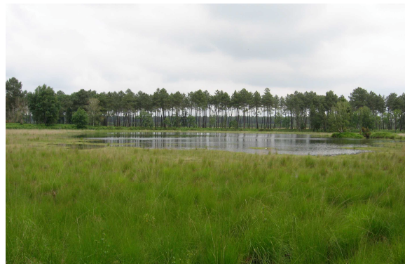
Lagune de la Roustousse