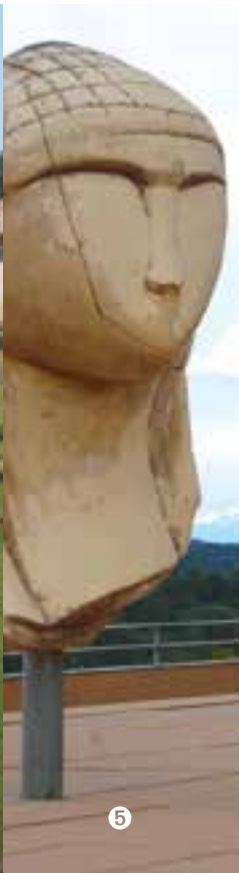
MAISON ET ARCHÉOPARC DE LA DAME DE BRASSEPOUY