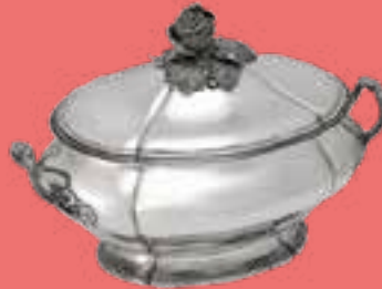
SOUPIÈRE EN ARGENT DE PARIS