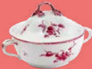
ÉCUELLE À BOUILLON PORCELAINE DE PONTENX -LES-FORGES (40)