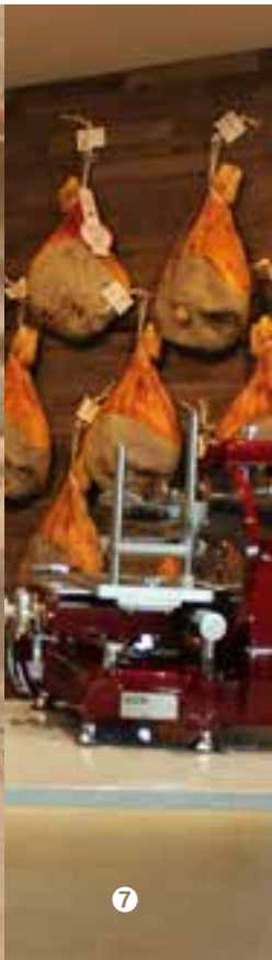
MAISON DU JAMBON