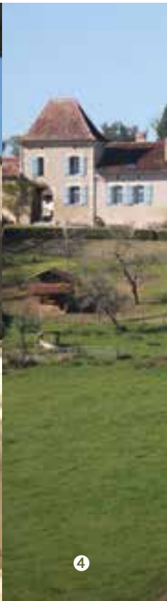
MUSÉE DE LA CHALOSSE