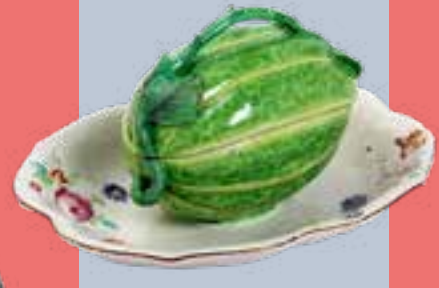
TERRINE EN FAÏENCE DE STRASBOURG