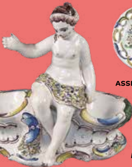
SALIÈRE À LA VÉNUS