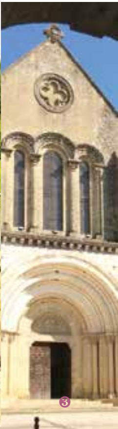
ABBAYE DE SAINT-SEVER