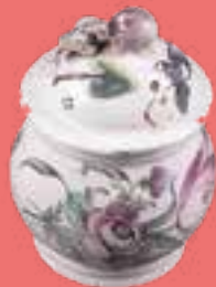
POT À JUS

Fondé en 1968 par le « Comité de la faïencerie » et donné au Département en 1998, le musée raconte les secrets de la «Manufacture royale de fayances » qui, de 1732 à 1838, employa une main d'œuvre aux savoir-faire spécialisés. Sa production, largement diffusée jusque dans les Iles, via l'Adour, les ports de Bayonne et de Bordeaux, fera la renommée du village jusqu'à sa fermeture au début du 19 e siècle. S'il ne reste plus traces des bâtiments, le musée conserve la mémoire de cette épopée. Il dévoile les techniques de fabrication et expose plus de 300 faïences aux formes et aux décors délicats.