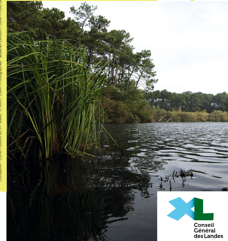
Conception : CG 40 – Edition 2015 – Textes : C. Roch / CG40 – Photographies : Sébastien Zamboni / CG40 – Photo de couverture : Etang de Moliets