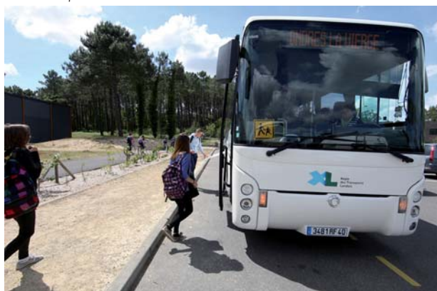
Transport scolaire - Labenne

Par ailleurs, de nombreux arrêts de rase campagne sont signalés par des bornes de couleur jaune fluorescent et des formations à la gestion des situations difficiles sont organisées par le Département à l'intention des conducteurs de cars pour leur permettre d'adapter au mieux leur comportement en cas de conflit ou d'incident.