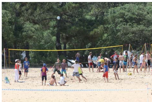
Journée UNSS 2015 - Soustons