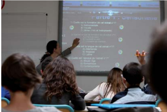
Visualiseur numérique - Labouheyre