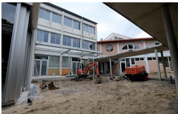
Travaux - Tarnos

Les opérations plus courantes ne sont pas oubliées : une enveloppe de 1,75 M€ y est consacrée en 2015 et permet, entre autres, la réalisation de travaux : agrandissement du garage à vélo au collège Jean-Mermoz de Biscarosse pour un montant de 40 000 € ;