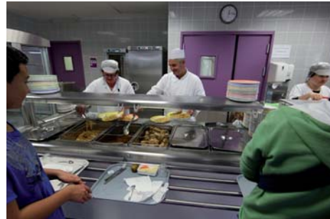
Restauration scolaire au collège d'Albret - Dax

Plusieurs dispositifs incitatifs (0,92 M€) permettent un financement intégral ou partagé au bénéfice des collèges qui décident de réaliser certaines opérations, de renouveler leurs équipements ou d'organiser des classes de découverte.