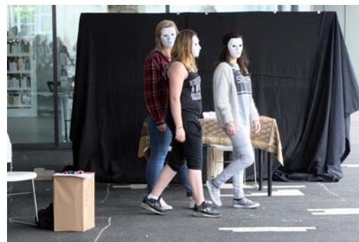
Culture en herbe - Aire-sur-l'Adour

Cet objectif de cohérence au service d'une éducation partagée des partenaires sera ainsi mis en lumière le 26 septembre à Rion-de-Landes lors d'une journée dédiée à la thématique « réforme des rythmes éducatifs et des projets éducatifs territoriaux (PEdT) ».