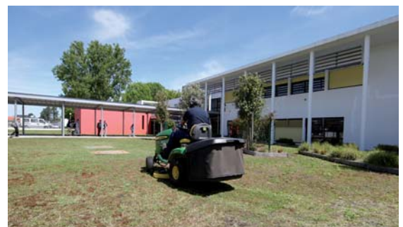
Agent technique départemental - Morcenx

Le Département a complété ces actions par une démarche de professionnalisation des agents portant sur la reconnaissance et la valorisation des métiers concernés, la détermination et la structuration d'un parcours de formation visant notamment le renforcement des compétences et la qualité du service public.