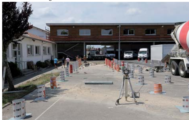
Travaux - Mugron

reprise du plateau de sport au collège Jules-Ferry de Gabarret pour un montant de 69 000 € ; création d'un espace casiers et reprise de la cour au collège Serge-Barranx de Montfort-en-Chalosse pour un montant de 108 000 € ; changement de menuiseries extérieures au collège Jean-Claude-Sescousse de Saint-Vincent-de-Tyrosse pour un montant de 35 000 €.