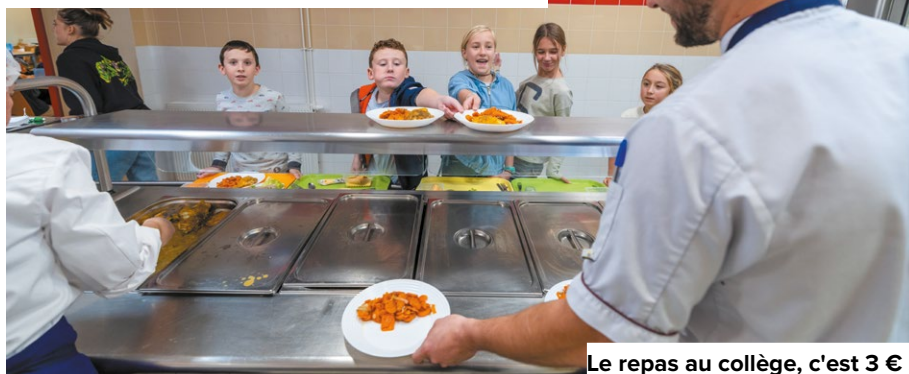
Le repas au collège, c'est 3 € !

E n matière de restauration scolaire, le Département a fait le choix de proposer aux collégiens des repas toujours plus qualitatifs tout en maintenant un objectif de justice sociale et d'éducation alimentaire. Le développement des circuits courts pour l'approvisionnement