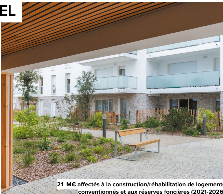
21 M€ affectés à la construction/réhabilitation de logements conventionnés et aux réserves foncières (2021-2026)

L ogements familiaux, pour personnes âgées ou en situation de handicap, jeunes en insertion, saisonniers, ménages aux ressources très modestes... Le travail sans relâche de XL Habitat, l'office public de l'habitat des Landes, a permis d'éviter que la programmation de logements sociaux ne s'effondre dans le département. Le principal bailleur social des Landes porte en effet 70 % des agréments délivrés par l'État. En 2024, XL Habitat engagera la mise en chantier de 750 logements locatifs sociaux et prévoit la livraison de 260 logements.