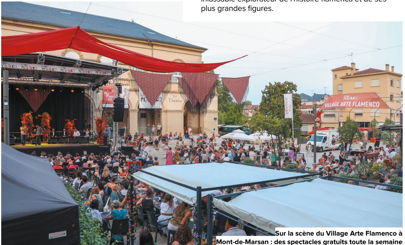
Sur la scène du Village Arte Flamenco à Mont-de-Marsan : des spectacles gratuits toute la semaine

L'affiche 2024 est signée de Patricio Hidalgo Morán, issue d'une série baptisée Sueño de una fiesta flamenca , où l'artiste sévillan travaille de l'abstrait au figuratif, de la tache au cri, du geste au mouvement. L'artiste est un inlassable explorateur de l'histoire flamenca et de ses plus grandes figures.