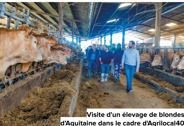
Visite d'un élevage de blondes d'Aquitaine dans le cadre d'Agrilocal40

Face aux différentes crises qui frappent l'agriculture, le Département est pleinement mobilisé pour soutenir et préserver le dynamisme du monde agricole sur son territoire. Il s'agit d'assurer la pérennité financière des exploitations tout en valorisant et en accompagnant une adaptation des pratiques aux enjeux climatiques et écologiques. 2,5 M€ sont fléchés pour accompagner la transition écologique de l'agriculture : reconquête du foncier, gestion qualitative et quantitative de l'eau, modernisation des exploitations.