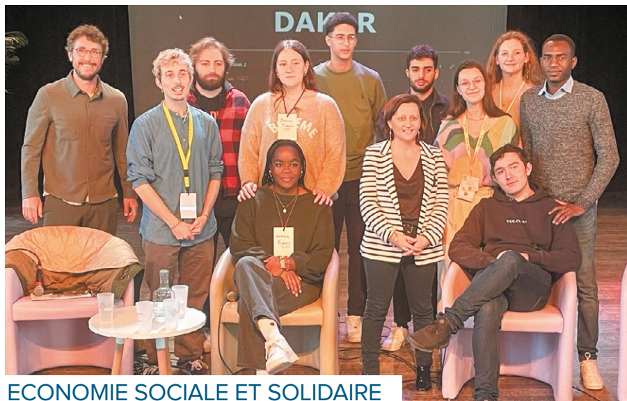
ECONOMIE SOCIALE ET SOLIDAIRE