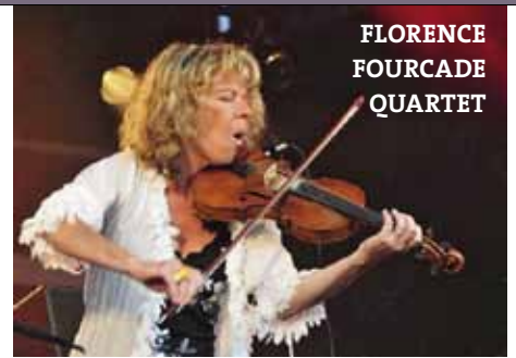
FLORENCE FOURCADE QUARTET

Elle est l'une des meilleures violonistes de jazz, et propose un très bel hommage à Stéphane Grappelli, qui fut le plus grand violoniste de jazz du XX e siècle.