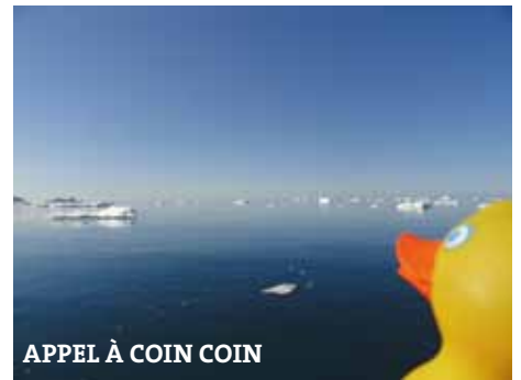
APPEL À COIN COIN