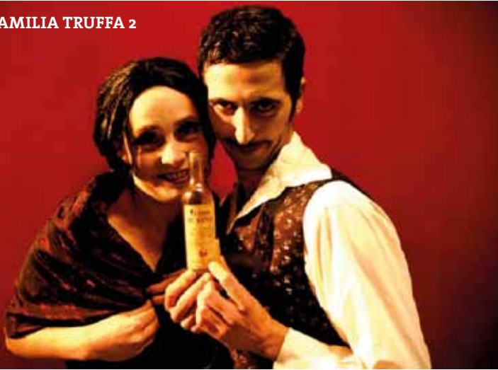
LA FAMILIA TRUFFA 2