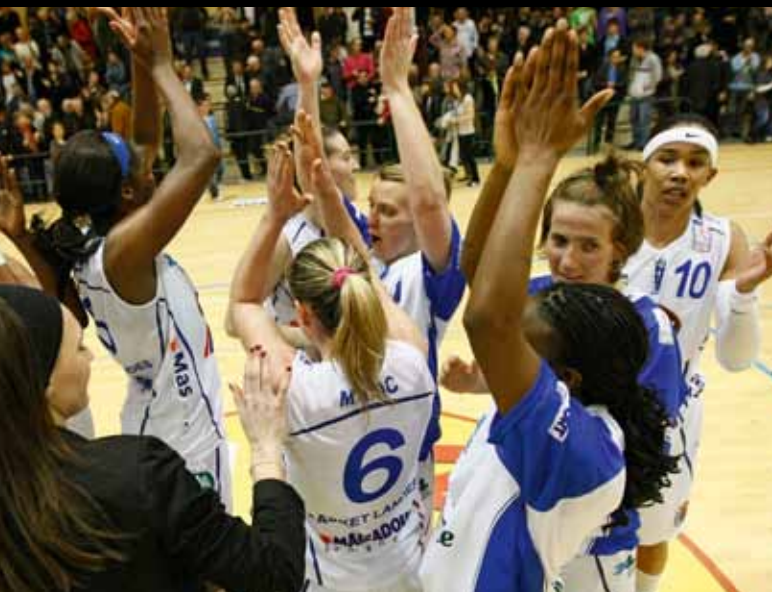
La délivrance face à Aix-en-Provence