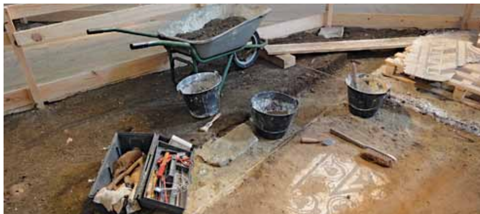
Reconstitution d'un chantier de fouilles.

L'exposition Land'archéo(1) dévoile les secrets de l'archéologie landaise. Entre méthodes scientifiques et approches artistiques contemporaines, 400 m 2 de déambulation attendent le public, jusqu'au 28 août 2011, à l'abbaye d'Arthous, à Hastings.