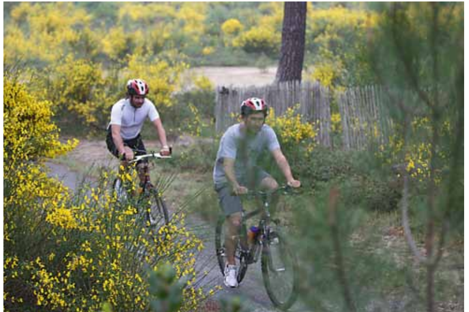
Le Plan départemental des Espaces Sites et Itinéraires a vocation à recenser les sites de pratiques de pleine nature.

Le PDESI. Derrière ce sigle, un objectif simple : le développement maîtrisé des sports de nature. Foire aux questions.