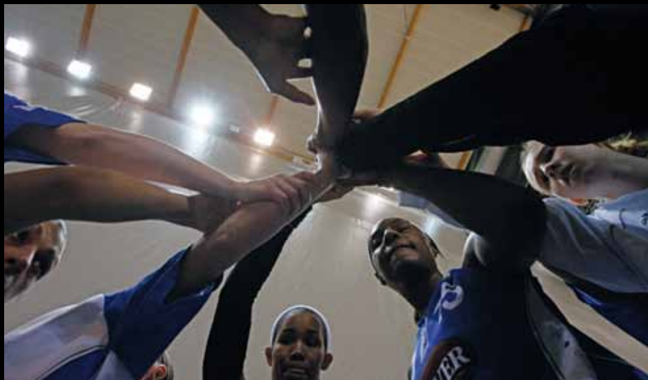
Début de match...