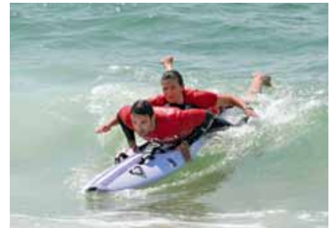
Le paddle board compte près de 1 000 licenciés dans le département.