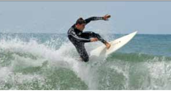
Le surf véhicule des valeurs indissociables de la préservation du milieu.