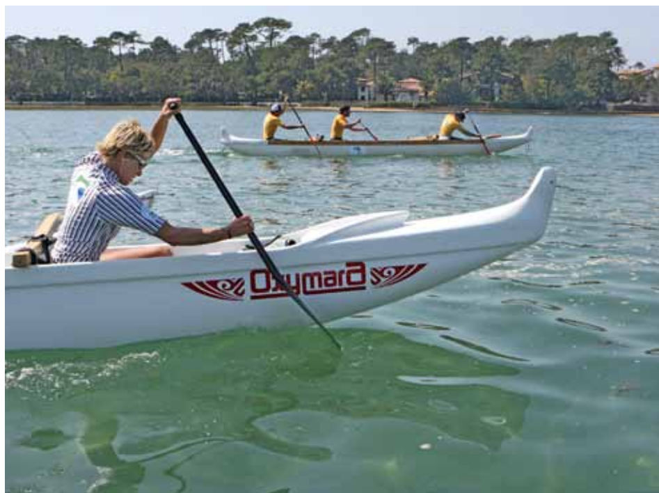
Le Raid XL se déroulera les 23 et 24 avril 2011.