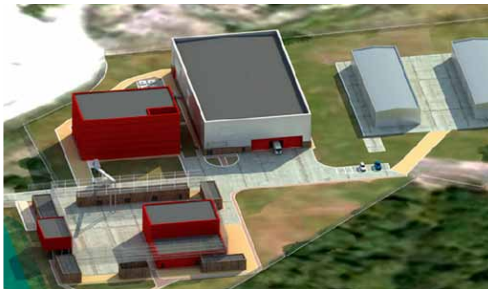
Vue 3D de l'unité de gazéification CHO-Power Morcenx.

Des perspectives très encourageantes pour le bassin économique Morcenais.