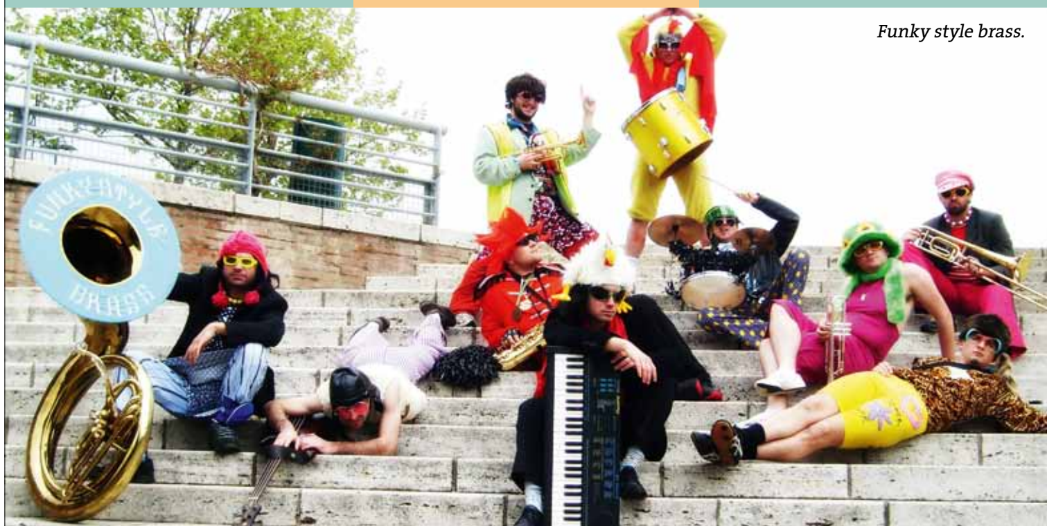
Funk style brass.

Pour circuler dans la convivialité et faire des économies, pensez covoiturage ! Rendez-vous sur www.covoituragelandes.org