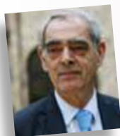
Henri Emmanuelli (PS)

Les 20 et 27 mars derniers, quinze conseillers généraux ont été élus ou réélus dans le cadre du renouvellement triennal. Découvrez la nouvelle Assemblée départementale.