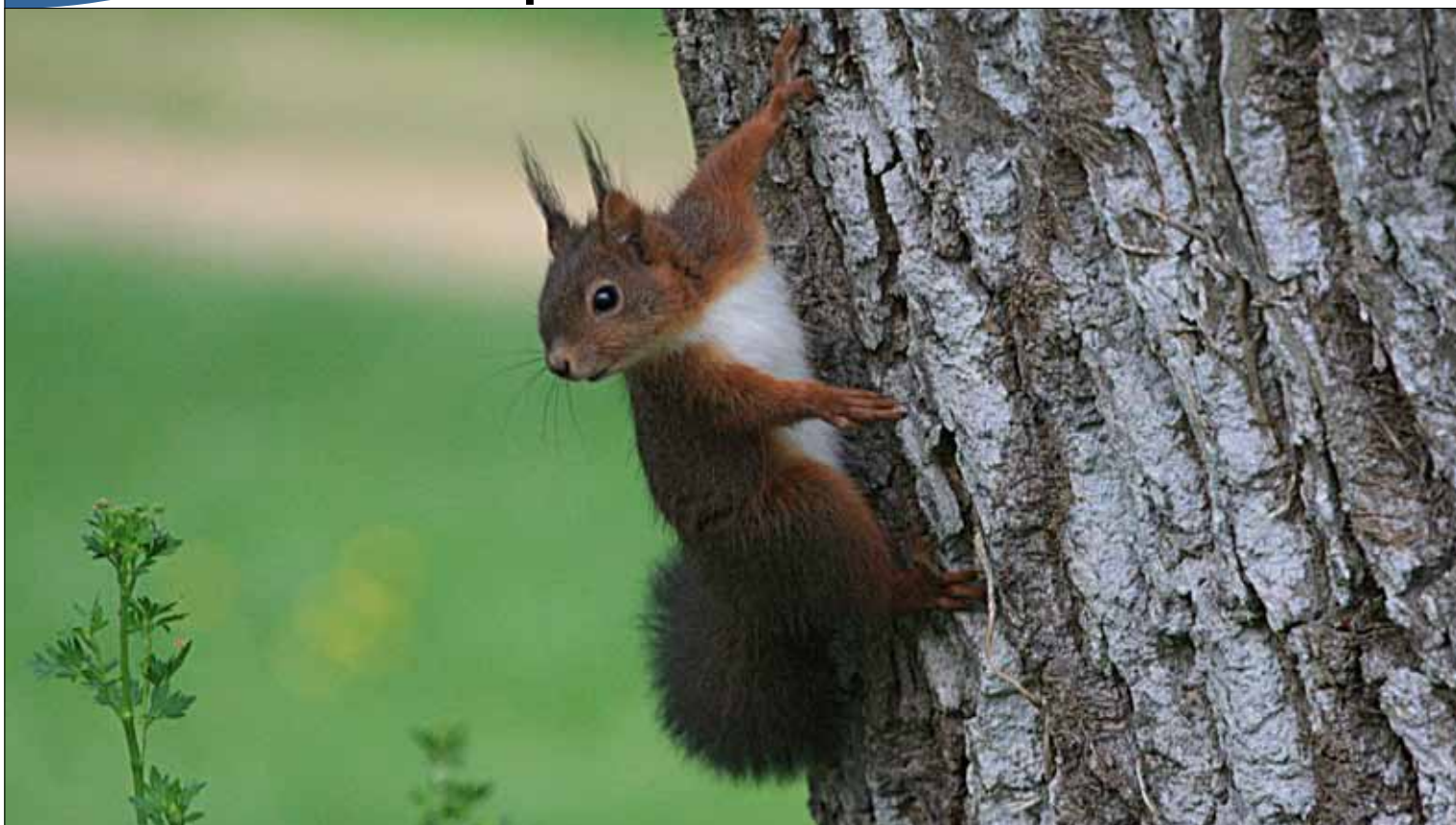
Christian Duprat - Gaillères

Les beaux jours reviennent... moi aussi !