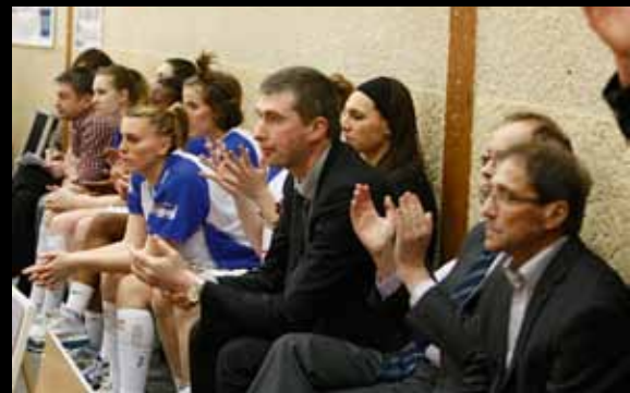
Visages fermés sur le banc contre Aix-en-Provence