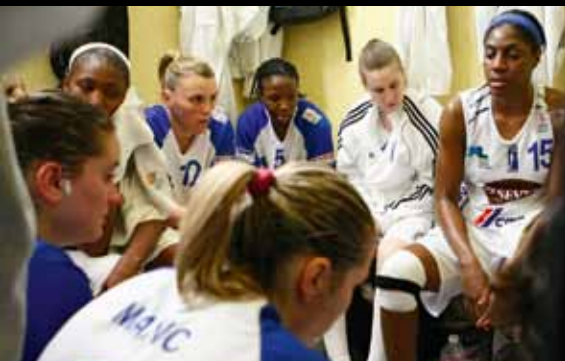
Dans les vestiaires, à la mi-temps

A savoir: le Comité Départemental du Sport Adapté des Landes (CDSA40) organisera du 26 au 29 mai 2011 le Championnat de France de Basket-ball Sport Adapté qui se déroulera sur le secteur du Grand Dax