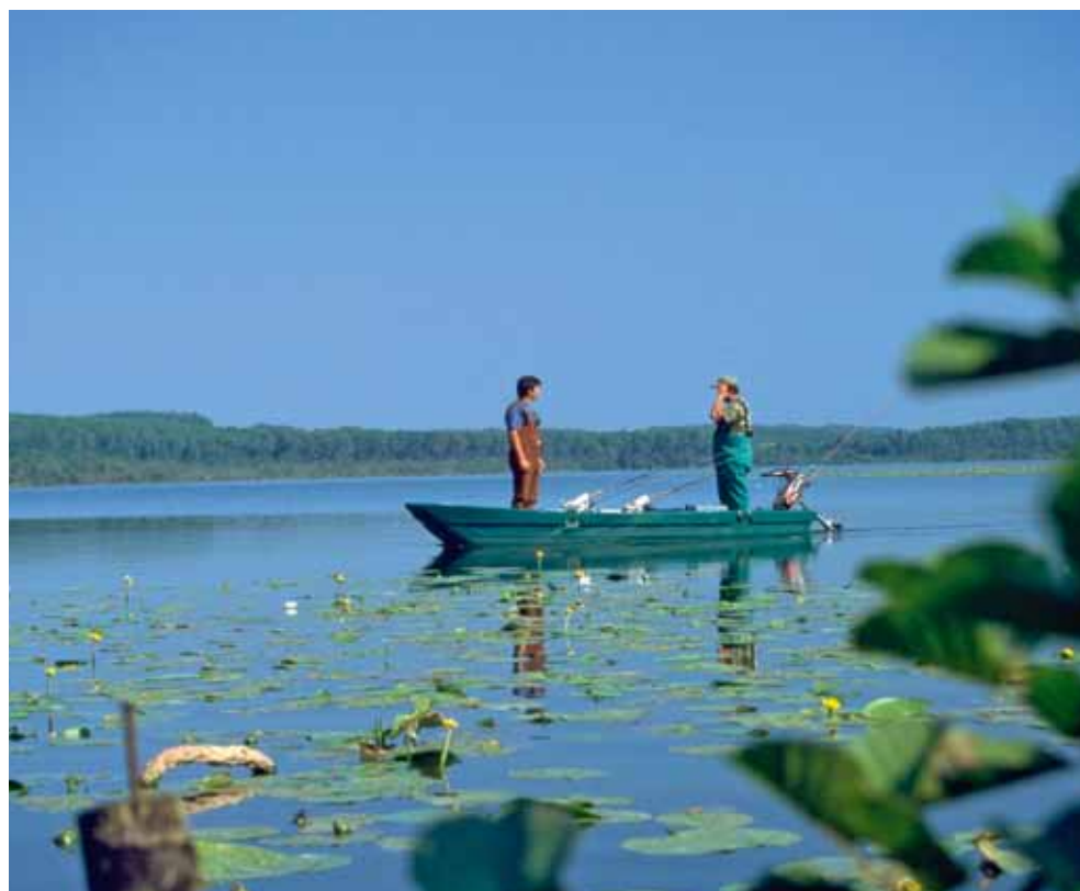
Le tourisme nature est l'un des axes prioritaires du CDT pour 2011.